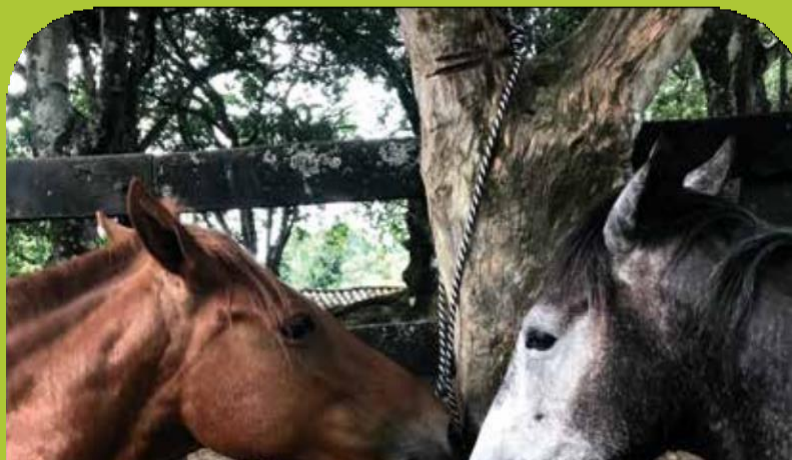
FOTO REAL, CONSUMIENDO BLOQUE GANADOR